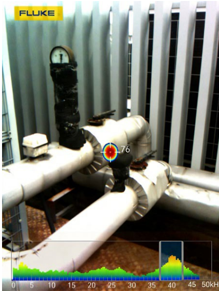
管道氣體洩漏檢測