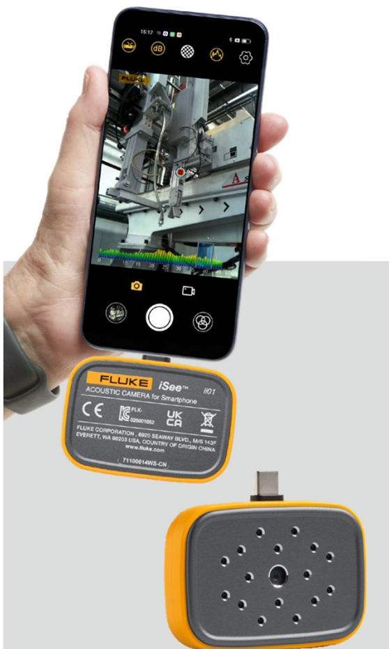
Fluke iSee ii01 手機聲學成像儀 口袋裡的聲學專家